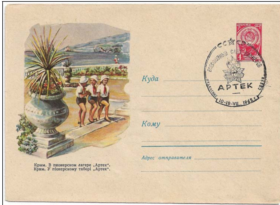
Afb. 4 (80 %)

Er zijn ook talloze enveloppen met ingedrukt zegel uitgegeven met Artek als thema. Mooi zijn vooral de postwaardestukken uit de jaren vijftig en begin jaren zestig (afb. 4). De envelop hieronder heeft ook een gelegenheidsstempel met ARTEK.