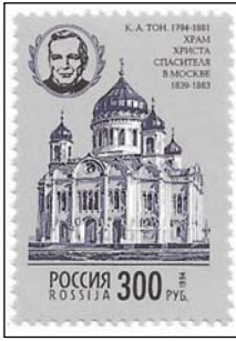
Afb. 2 (100 %)

Hij keurde in 1817 het ontwerp goed: een neoclassicistisch gebouw met vrijmetselaars-symboliek. De geplande plek voor het gebouw bleek echter niet stevig genoeg. In 1825 volgde zijn broer hem op, de orthodoxe Nicolaas I. Hij voelde niets voor het ontwerp en liet Konstantin Thon ( afb. 2 ) een nieuw ontwerp maken.