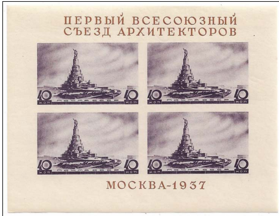
Afb. 5 (100 %)

gebouw met bovenop een gigantisch standbeeld van Lenin. In 1937 werd een blok uitgegeven met postzegels waarop het gebouw te zien is ( afb. 5 ).