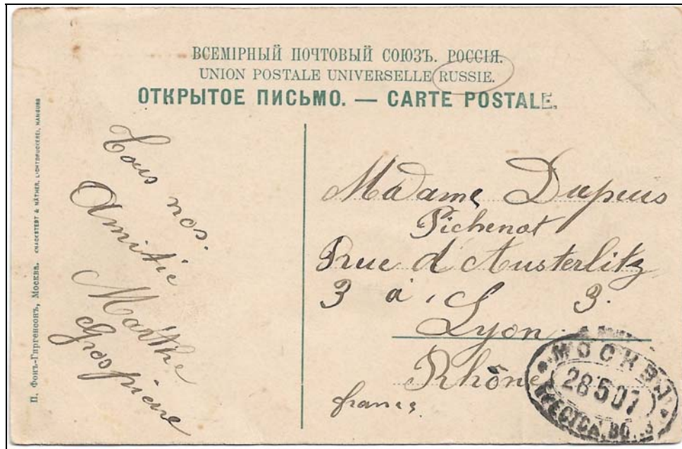
Afb. 3b (90 %)

De ouverture 1812 van Tsjaikovski was geschreven met het oog op de voltooiing van de kathedraal, maar de wereldpremière vond plaats in een tent buiten de onvoltooide kerk in augustus 1882. Op 26 mei 1883 werd de kathedraal ingewijd, de dag voordat Alexander III werd gekroond in de Oespenskikathedraal in Moskou.