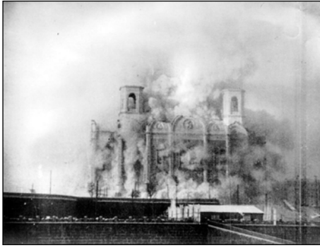
Afb. 4 5 december 1931.

Daarna werd nog een internationale ontwerpwedstrijd gehouden, maar geen enkel ontwerp werd zonder meer geschikt geacht door de Raad.