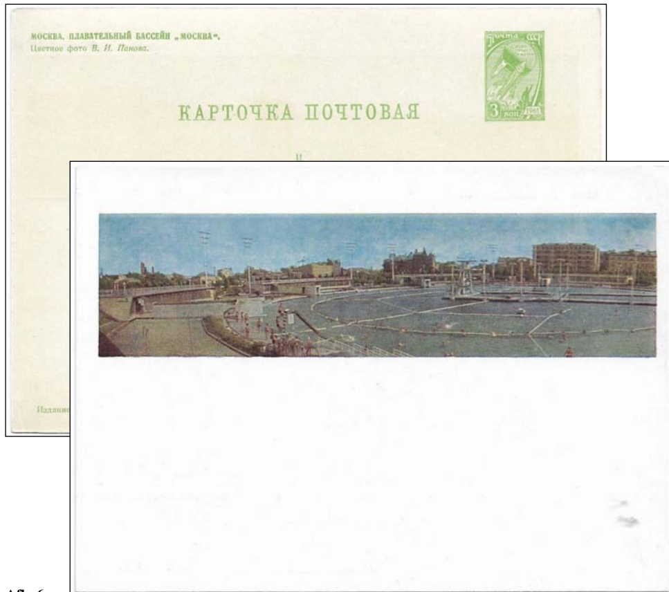
Afb. 6 (77 %)

In 1958 besloot de gemeenteraad van Moskou om de fundamenteën van het Paleis te verbouwen tot het Moskva-zwembad: het grootste verwarmde openluchtzwembad ter wereld, in gebruik tussen 16 juli 1960 tot 1991 ( afb. 6 ).