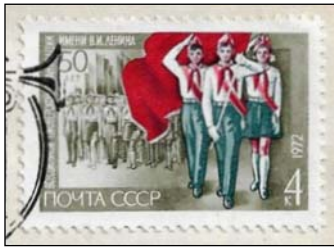
Afb. 5 Mi. 4006 van de serie Mi. 4003-4006 (1972): 50 jaar Pioniersorganisatie.