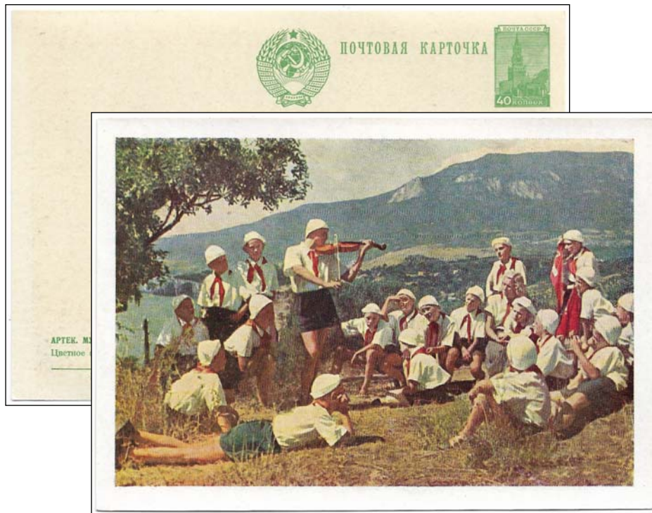
Afb. 3 (70 %)

In de Sovjet Unie zijn heel veel Ansichtkaarten met ingedrukt zegel, postwaardestukken dus, uitgegeven. Een aantal heeft Artek als thema (o.a. 23/V 1962, 14/V-75, 1/II-78, 21.09.79, 28.10.86), maar de kaarten uit de jaren vijftig hebben iets romantisch, nostalgisch (afb. 1, 2 en 3).