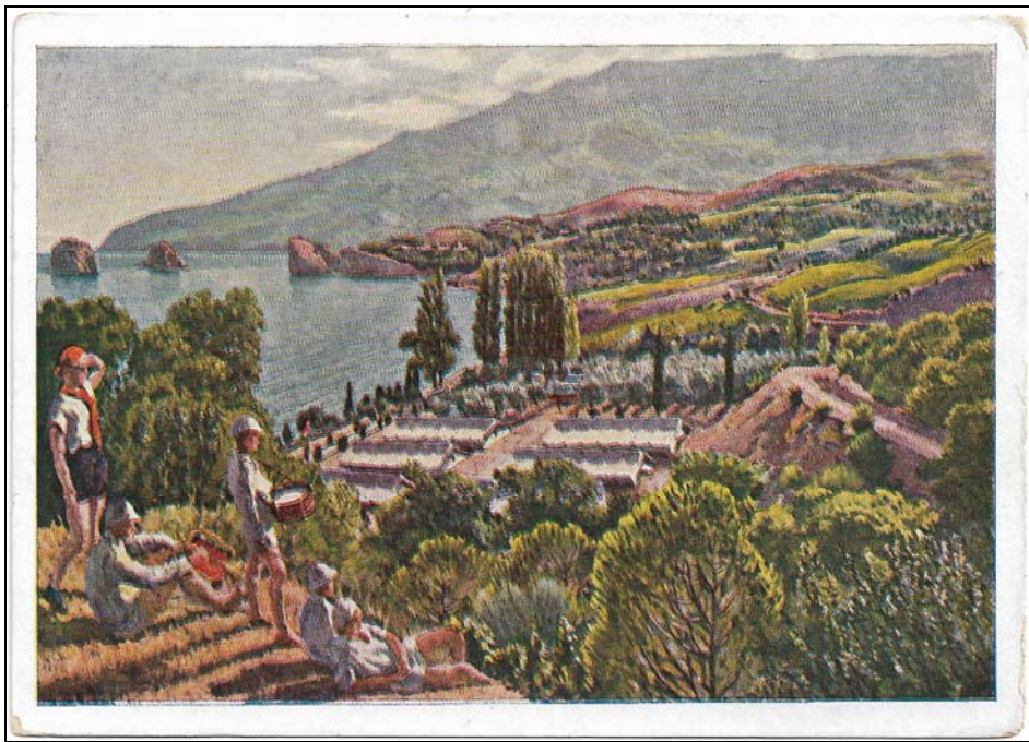
Afb. 1a (83 %)

De organisatie van Jonge Pioniers werd in 1922 opgericht als een tak van de Komsomol voor de 10 tot 15-jarigen. Men wilde geen Scouting-beweging, omdat veel scouts in het Witte Leger tegen het Rode Leger hadden gevochten, maar wel een jeugdbeweging die de communistische leer aan de jeugd doorgaf. Er zijn natuurlijk wel elementen van de scouting overgenomen: de slogan "Be Prepared", wat in Nederland vertaald werd als "Wees Paraat" voor jongens en "Wees Bereid" voor meisjes. Wel met een aanpassing, het motto kreeg twee delen: een oproep "Pionier, bereid u voor op de strijd voor de zaak van de Communistische Partij van de Sovjet-Unie!" met het antwoord "altijd voorbereid!" (versie 1986).