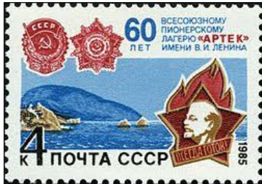
Bij het 60-jarig bestaan van de Artek gaf de Sovjet-Unie een zegel uit: Mi. 5523 (afb. 7).