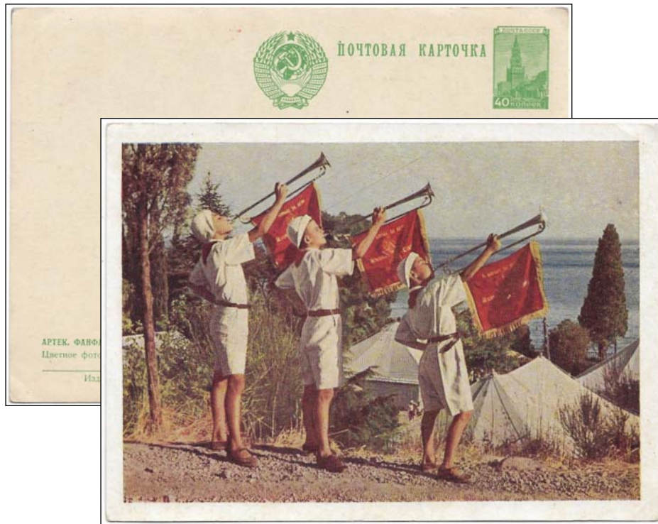
Afb. 2 (70 %)

Hierop aansluitend -ongeveer op 14-jarige leeftijd- stapten de kinderen over op de Komsomol, de communistische jongerenorganisatie. Daar bleven ze lid van tot ze 25-28 jaar waren. Daarna kon men proberen lid van de Communistische Partij te worden.