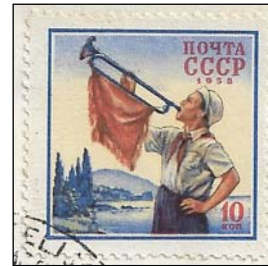
Afb. 6 Mi. 2087 van de serie Mi. 2087-2088 (1958)