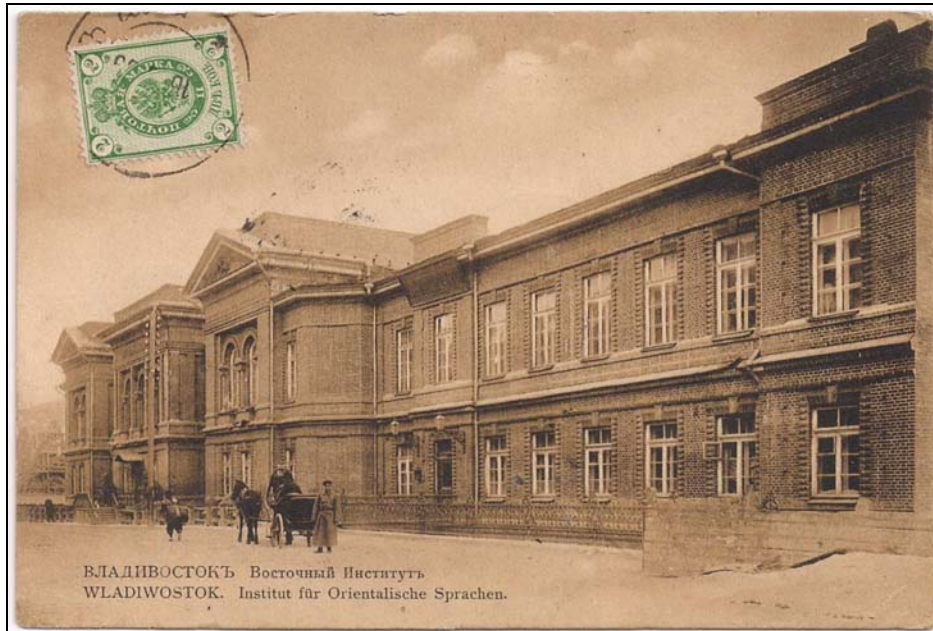
Afb. 4a (90 % ware grootte) Het Oriëntaalse Instituut.