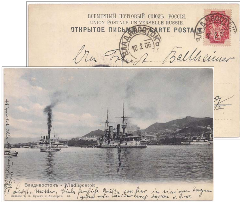
Afb. 2 (80 % ware grootte)

Nikolajevsk aan de Amoer -80 kilometer van de monding- werd na de stichting op 13 augustus 1850 het belangrijkste bestuurlijke centrum en grootste haven in het Oosten van Rusland. De marinehaven, de residentie van de militaire gouverneur en het hoofdkwartier van de Siberische militaire vloot werden in 1871 verplaatst uit Nikolajevsk naar Vladivostok. De haven van Vladivostok komt uiteraard ook op ansichtkaarten voor (afb. 2).