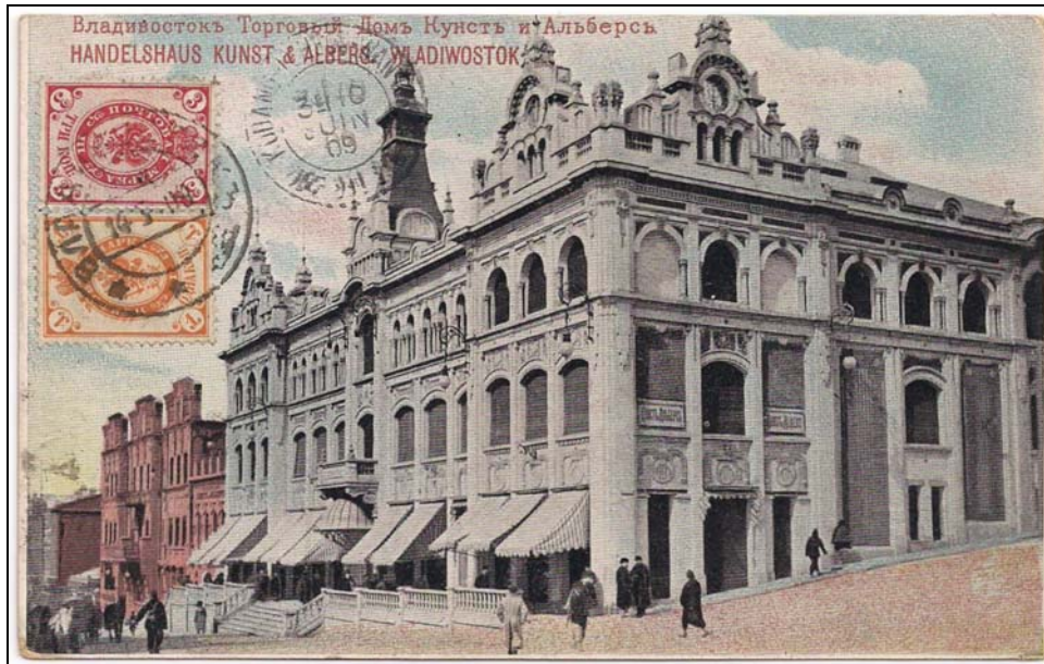
Afb. 3a (89 % ware grootte)

De Tsesatevich is gebouwd tussen 1899 en 1903 in Frankrijk en is het basisonwerp voor de in Rusland gebouwde Borodina-klasse slagschepen. De thuishaven was Port Arthur (Mantsjoerije). Het schip vocht in de Russisch-Japanse Oorlog 1904-1905 en werd na deze oorlog deel van de Baltische Vloot.