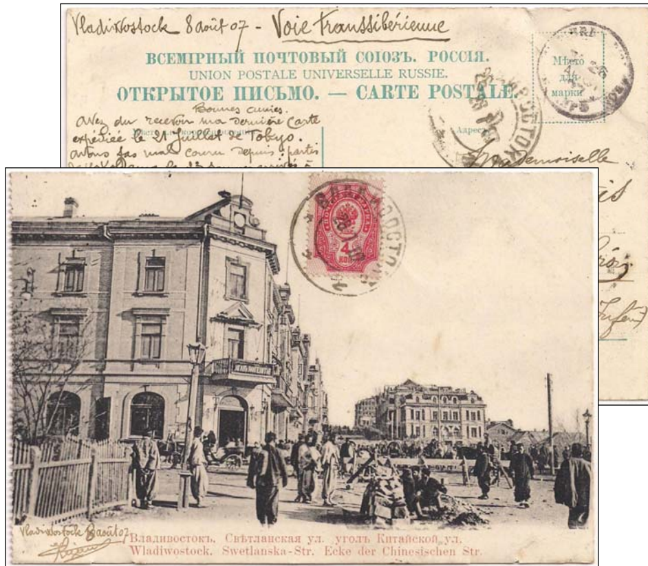
Afb. 1 (80 % ware grootte) 'Wladiwostock. Swetlanska-Str. Ecke der Chinesischen Str.'

De Ansichtkaart hieronder is in 1907 verzonden uit Vladivostok naar Frankrijk.